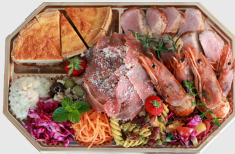
オードブルプレミアム S 4500(4860) M 6000(6480) *写真はMサイズ