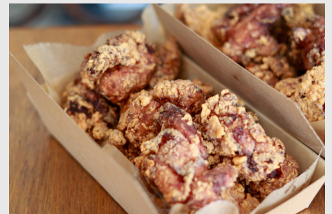
愛媛今治からあげ 「せんざんき」

5個 550(594)/10個 1100(1188) 1個追加ごと +110(118)