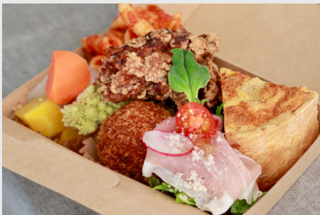
キッシュBOX S (唐揚げ) 1100(1188)