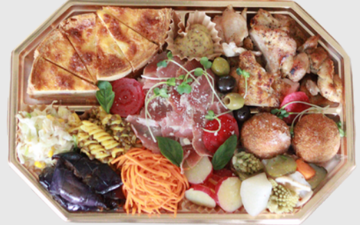
オードブルスタンダード S 3500(3780) M 5000(5400)