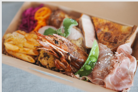
キッシュBOX M (ポーク) 1600 (1728)