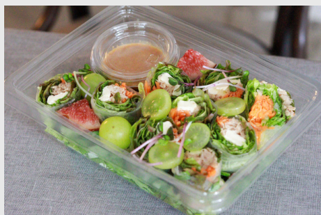
クリームチーズ生春巻き エビ 1200(1296) ツナ 1000(1080)